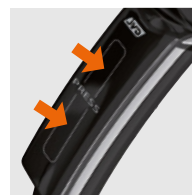
SISTEMA DE ENCENDIDO PATENTADO